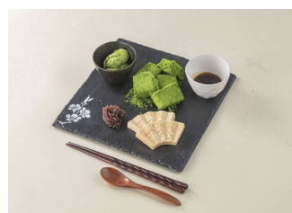
抹茶わらび餅Set CAFÉ限定商品